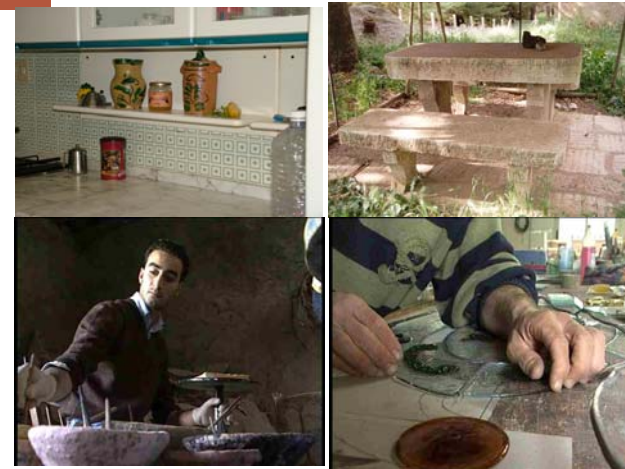
MÉRITE: Méditerranée Rurale d'excellence – Innovation – Territoire Entreprise

LUCCA, 11 – 13 ottobre 2004: seminario “Les perspectives”