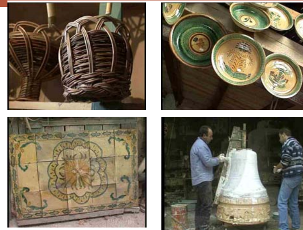
MÉRITE: Méditerranée Rurale d'excellence – Innovation – Territoire Entreprise

LUCCA, 11 – 13 ottobre 2004: seminario “Les perspectives”