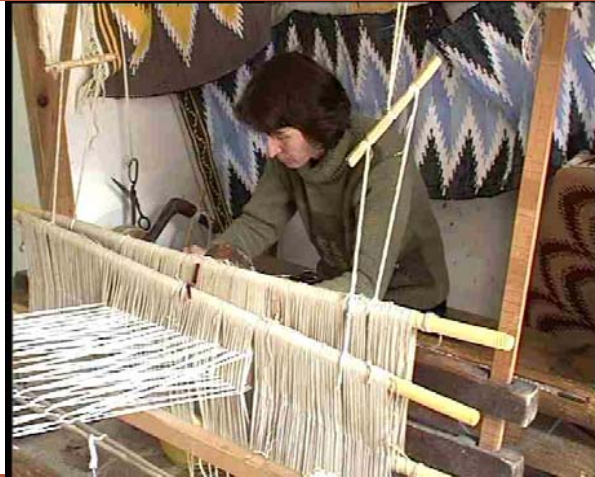
MÉRITE: Méditerranée Rurale d'excellence – Innovation – Territoire Entreprise

LUCCA, 11 – 13 ottobre 2004: seminario “Les perspectives”